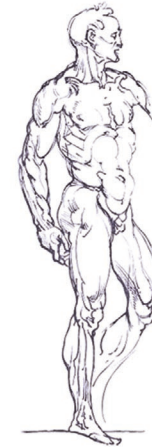
Stütz- und Bewegungsapparat